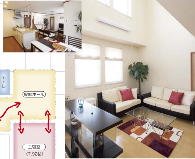
室内写真は当社施工実例によるイメージです