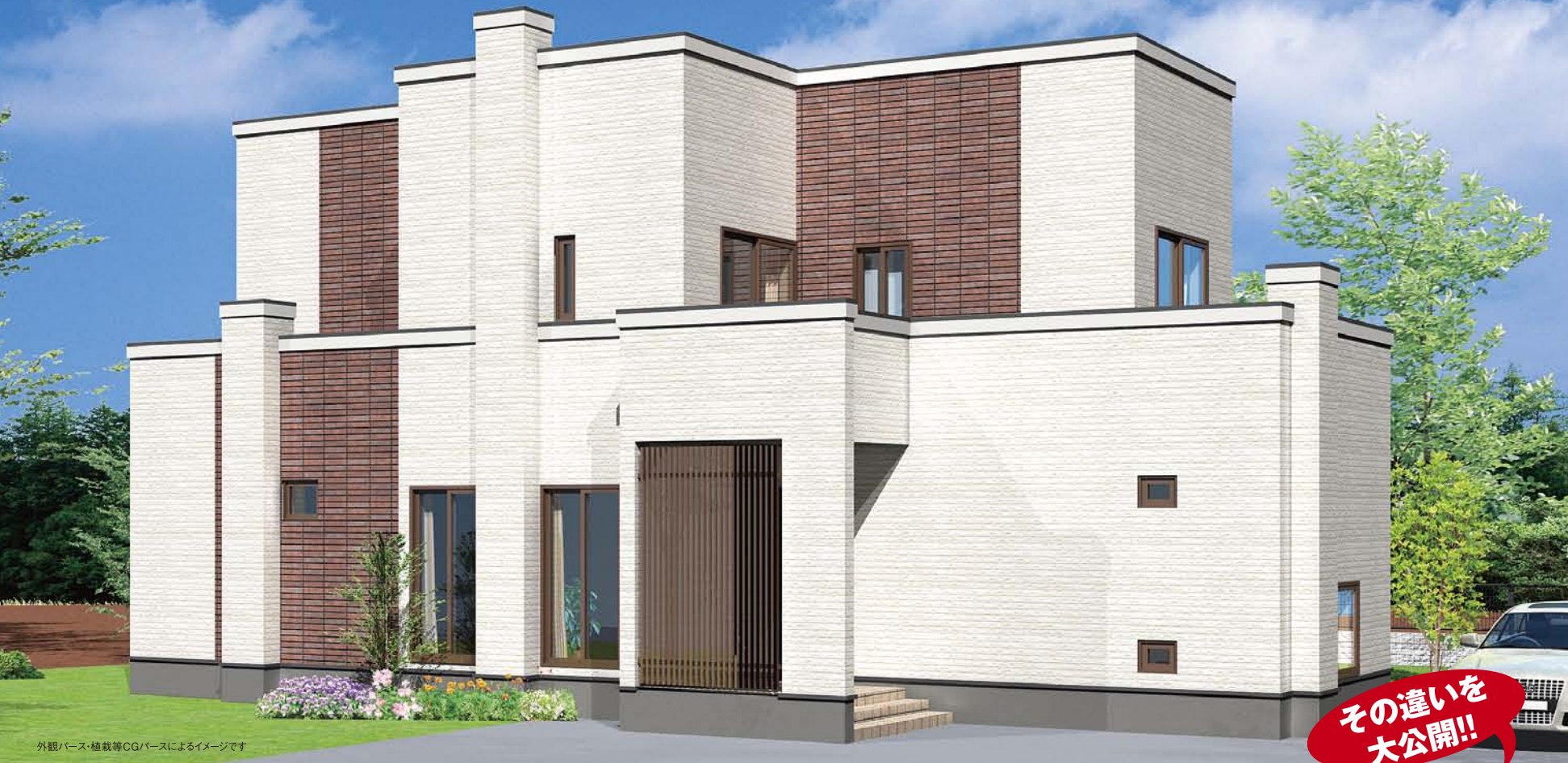
外観パース・植栽等CGパースによるイメージです